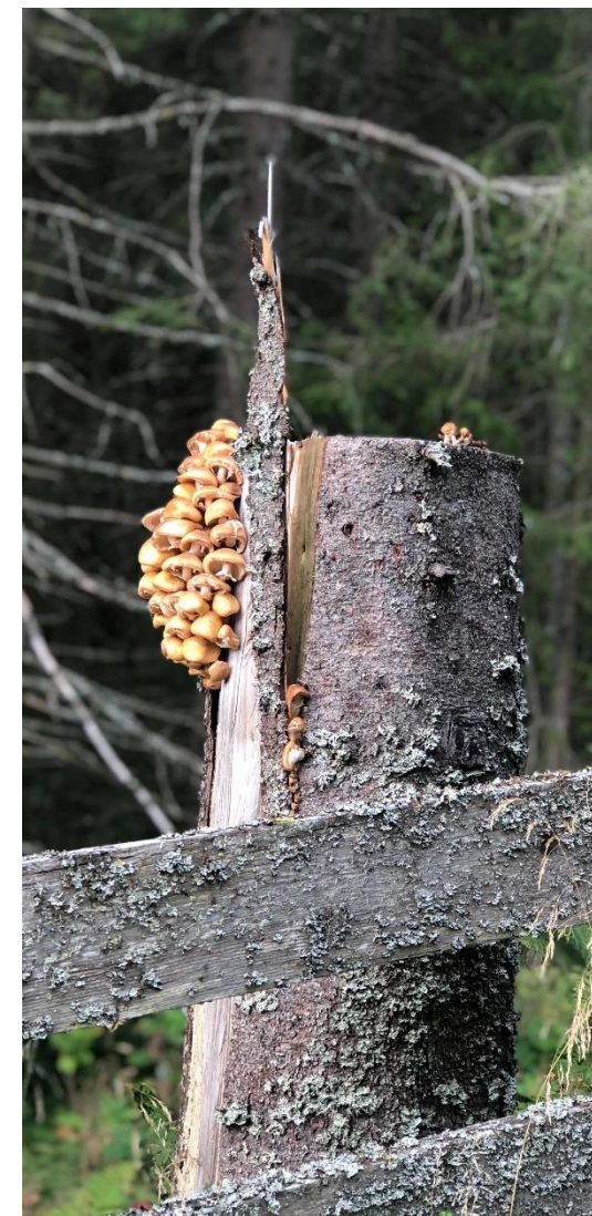
En oppdagelse fra en tur på storbarn fra August

Storbarn vil stort sett bruke gapahuken «Tuva» på tur. Her er barna godt kjent og gapahuken ligger fint til i et skogsområde et lite stykke fra barnehagen. De ulike årstidene gir oss mulighet til å oppleve naturen rundt gapahuken ulikt. På vei opp til gapahuken er det alltid noe å undersøke og undre seg over og vi tar oss alltid tid til å undre oss sammen med barna. Småbarna vil bruke nærmiljøet rundt barnehagen, der vi tilrettelegger for lek, undring, læring og utforskning. Det blir også turer i «Brumundbussen» i nærmiljøet.