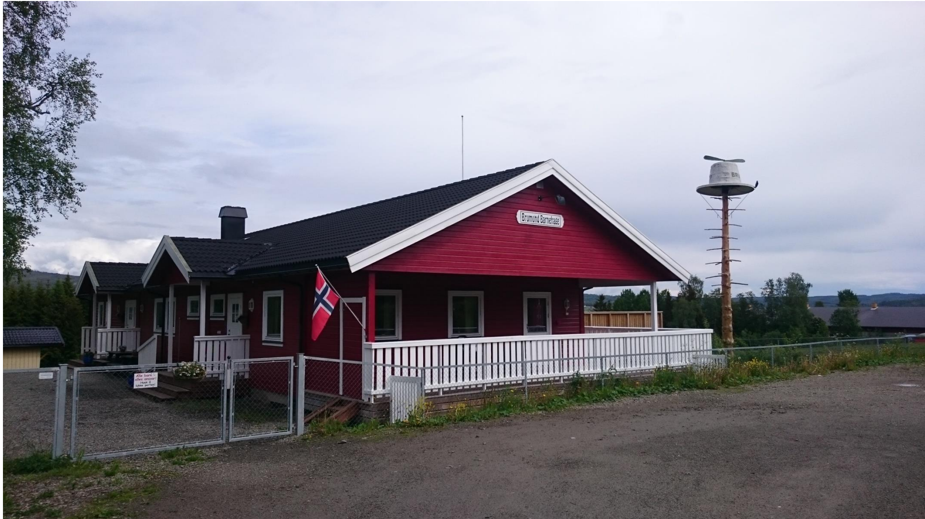
Årsplan for Brumund barnehage 2022/2023