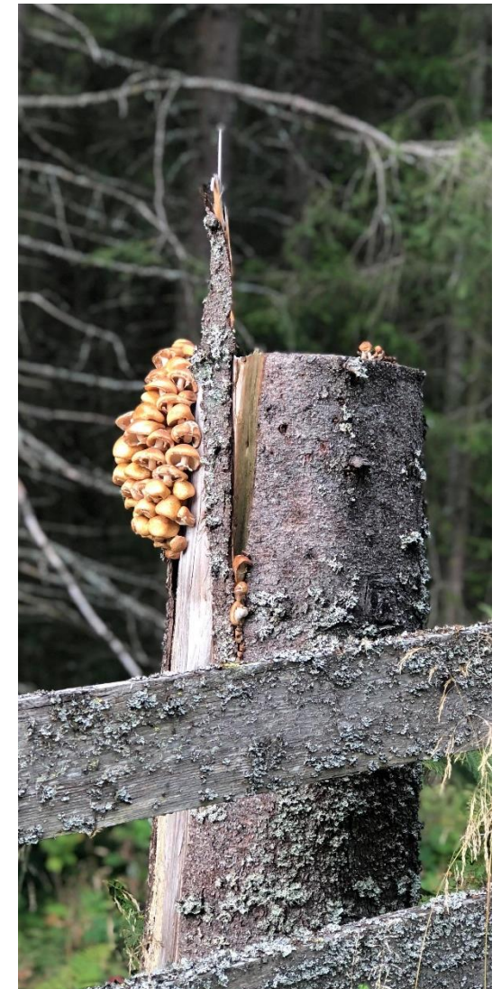
En oppdagelse fra en tur på storbarn fra August

Storbarn vil stort sett bruke gapahuken «Tuva» på tur. Her er barna godt kjent og gapahuken ligger fint til i et skogsområde et lite stykke fra barnehagen. De ulike årstidene gir oss mulighet til å oppleve naturen rundt gapahuken ulikt. På vei opp til gapahuken er det alltid noe å undersøke og undre seg over og vi tar oss alltid tid til å undre oss sammen med barna. Småbarna vil bruke nærmiljøet rundt barnehagen, der vi tilrettelegger for lek, undring, læring og utforskning. Det blir også turer i «Brumundbussen» i nærmiljøet.