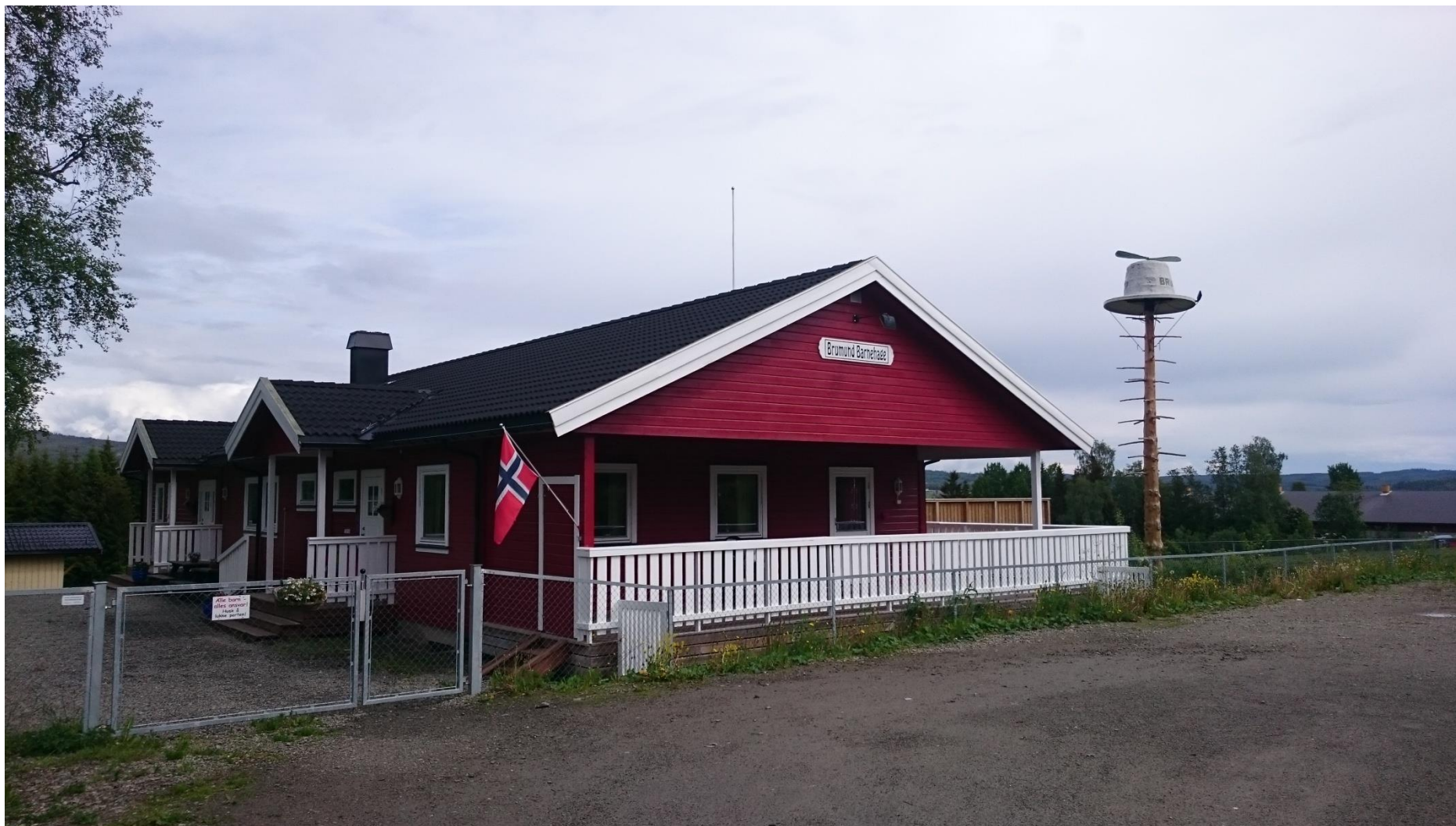
Årsplan for Brumund barnehage 2024/2025